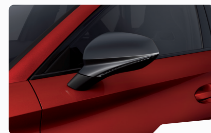
אדום כהה יין E1E1