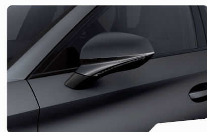
אפור מט 9R9R