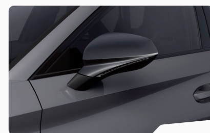
אפור גרפיט R6R6