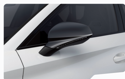
כבן נבדה 2Y2Y