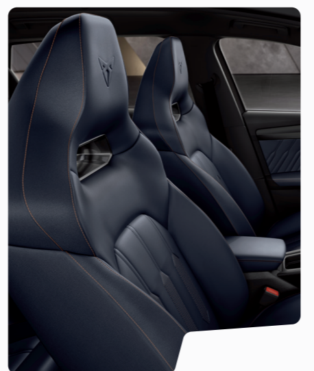
מושב באקט עור כחול