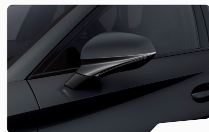
אפור מטאלי S7S7