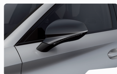
כסוף מטאלי L5L5