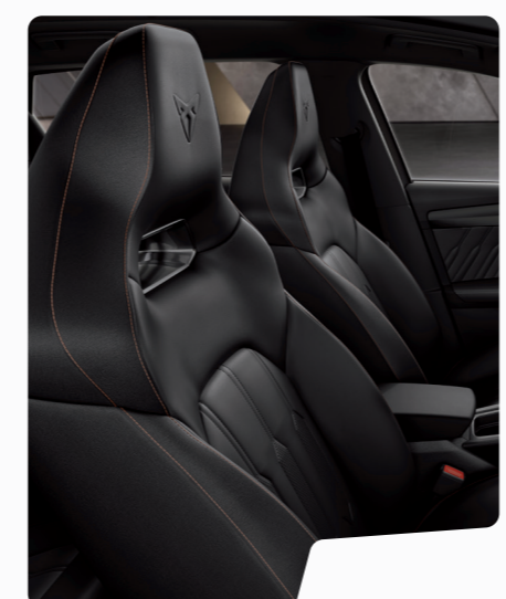
מושב באקט עור שחור