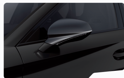
שחור מטאלי OE0E