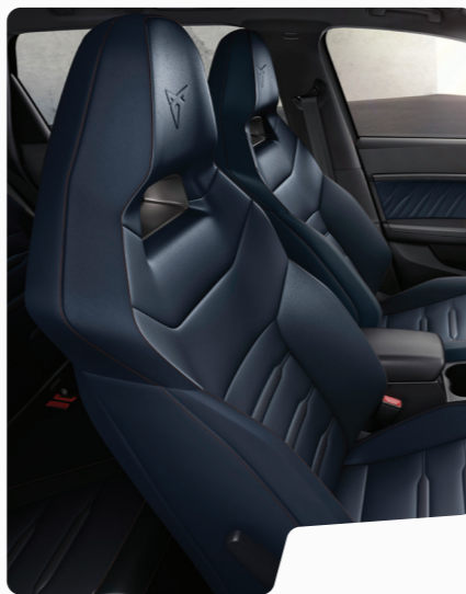
מושב באקט עור כחול