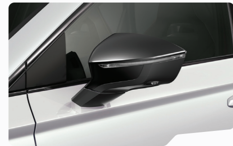
לבן נבדה 2Y2Y