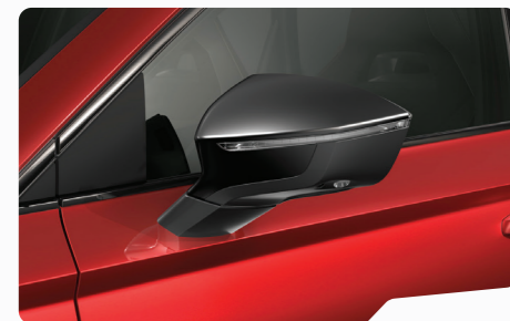
אדום כהה יין E1E1