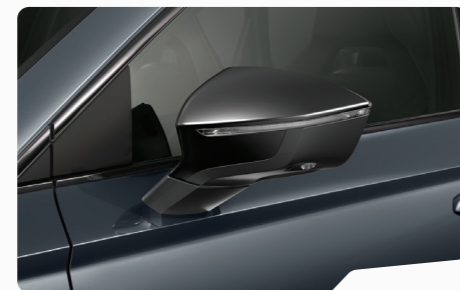
אפור מטאלי S7S7