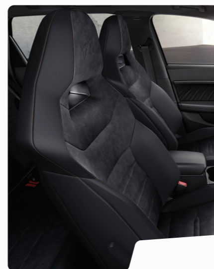
מושב באקט בד